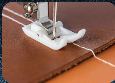
Motore a corrente continua Cucitura potente e più forte