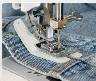
Supporto per jeans