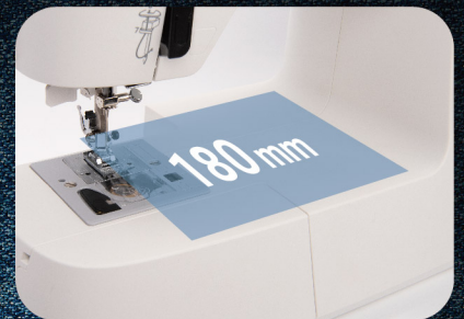
180mm Ampia area di lavoro