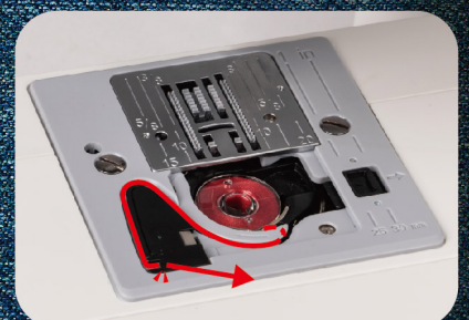
Caricamento rapido spoletta dall'alto