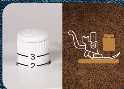
Pressione piedino regolabile