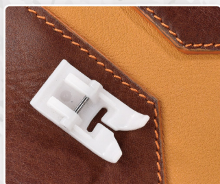
Piedino anti attrito